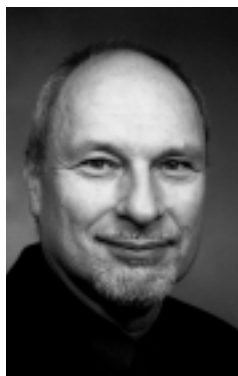
Propos recueillis par Didier Erard