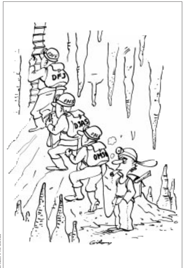
Dessin Yves Giroud